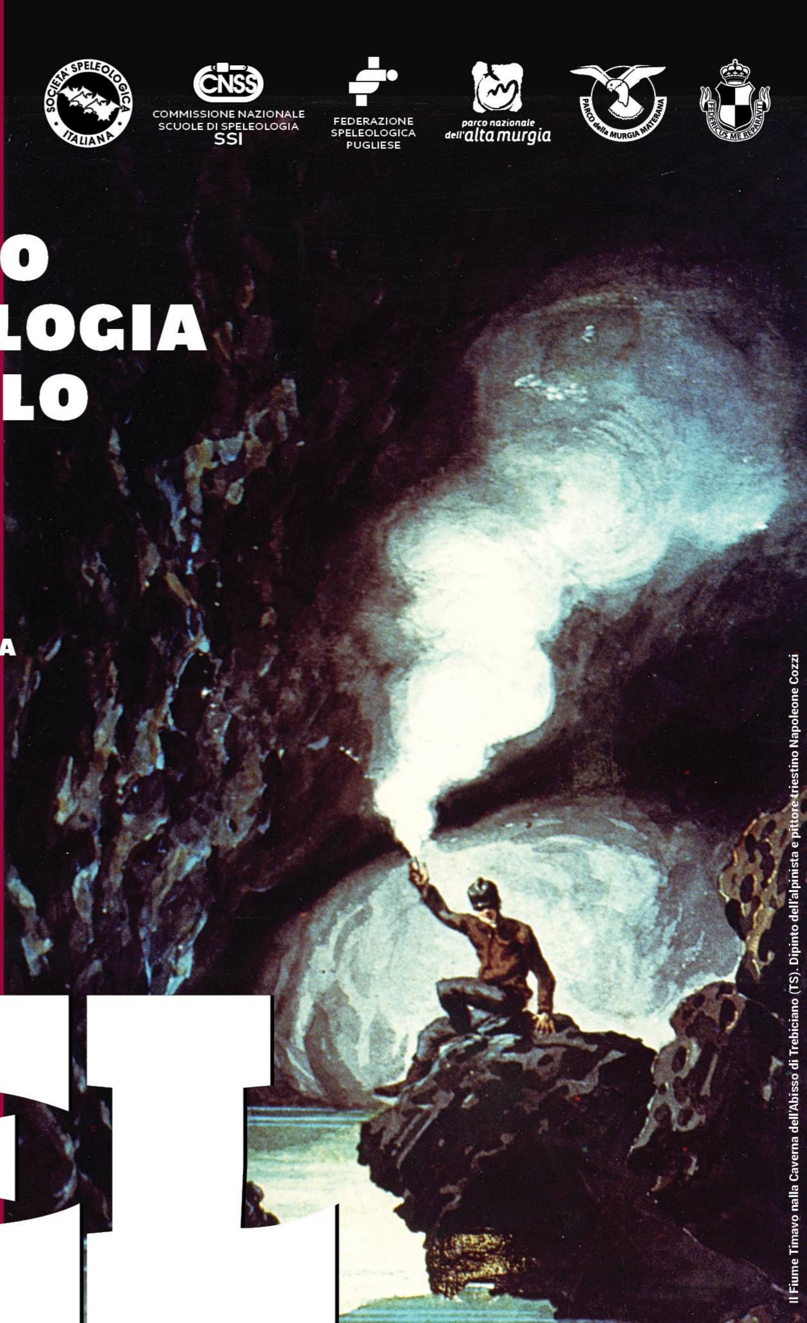
Il Fiume Timavo nella Caverna dell'Abisso di Trebbiano (TS). Dipinto dell'alpinista e pittore triestino Napoleone Cozzi

Il corso avrà inizio il 17 aprile 2015 alle ore 21 e si svolgerà da aprile a maggio con lezioni teoriche e pratiche.