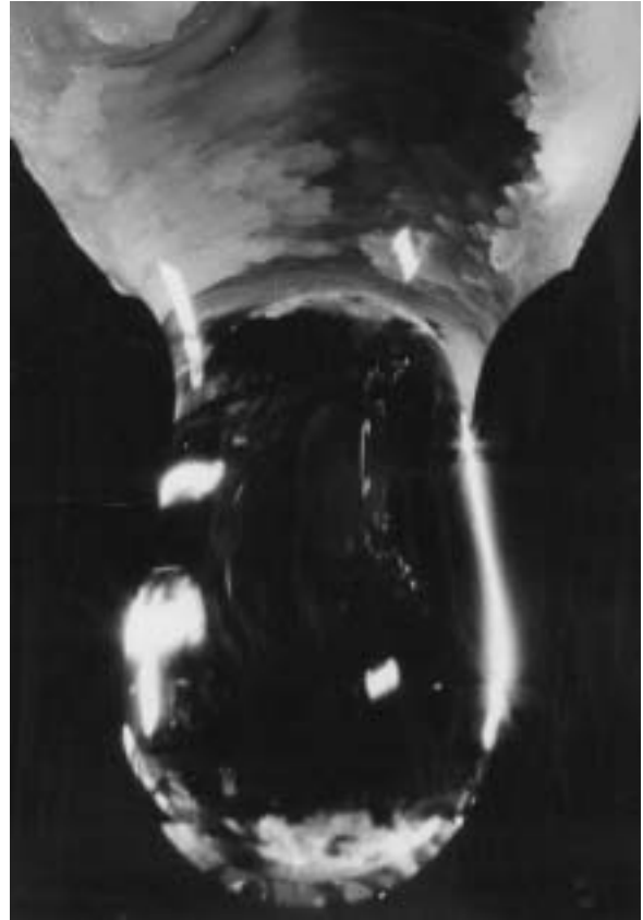
Fig. 7 - Goccia di stillicidio - particolare.