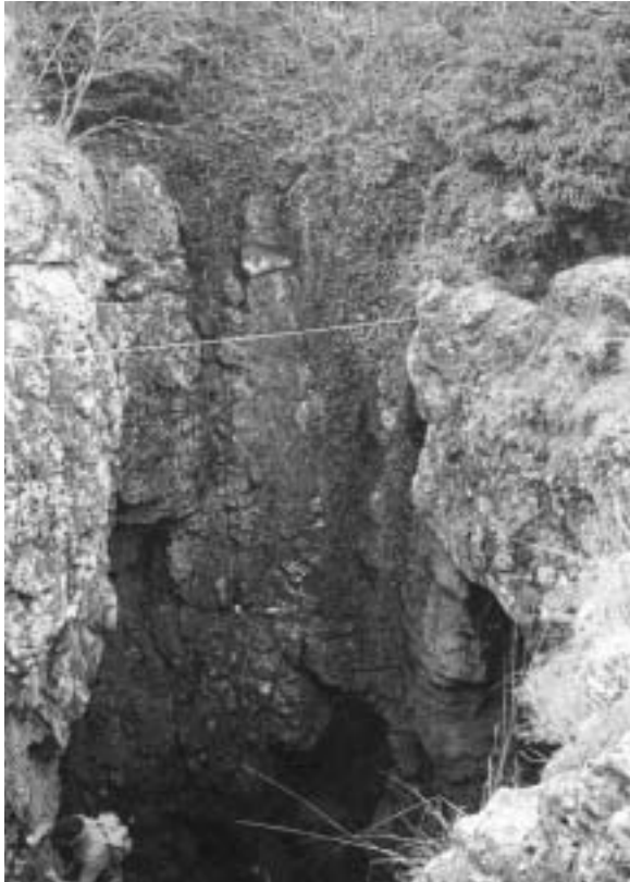
Fig. 6 - Momento iniziale della discesa durante la prima esplorazione della Grave di Fraualla .