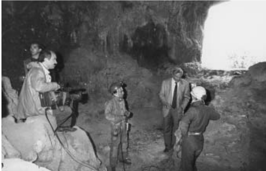
Fig. 20 - Speleologi del C.A.R.S. e Piero Angela nella grotta della Capra durante la preparazione delle riprese all' Uomo di Altamura .