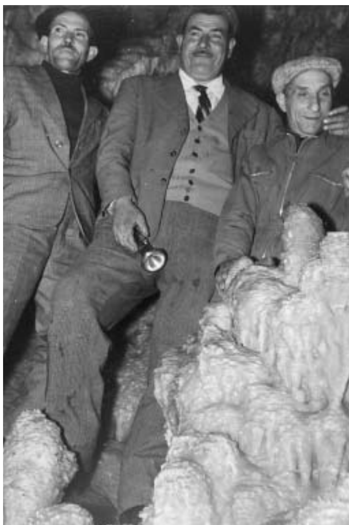
Fig. 3 - Speleologi all'interno della Grotta di Torre di Lesco durante la seconda esplorazione.