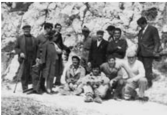
Fig. 8 - Grotta di Minervino Murge - Gruppo di speleologi.