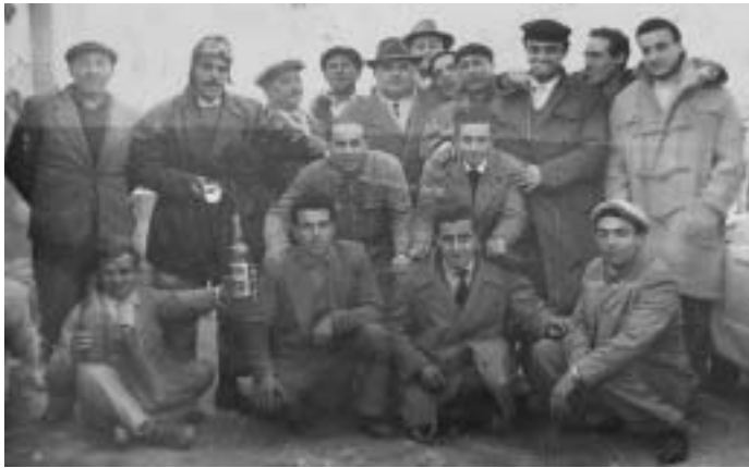
Fig. 1 - La prima esplorazione alla Grotta di Torre di Lesco nel 1951.

Si è operata una selezione tra le principali e significative immagini conservate nell'archivio fotografico del C.A.R.S., al fine di fornire una idea sequenziale di cinquant'anni di attività.