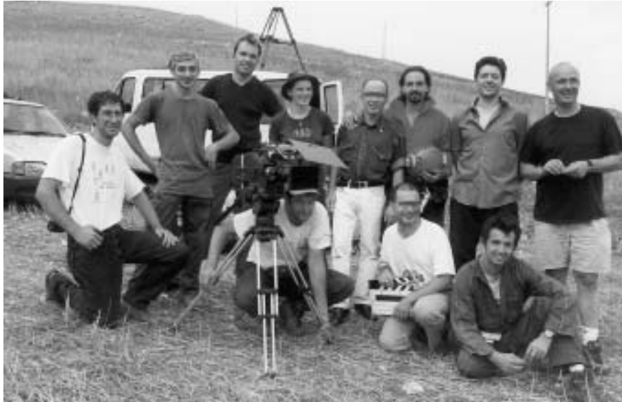
Fig. 22 - Speleologi del C.A.R.S. e tecnici della B.B.C. dopo le riprese all' Uomo di Altamura .