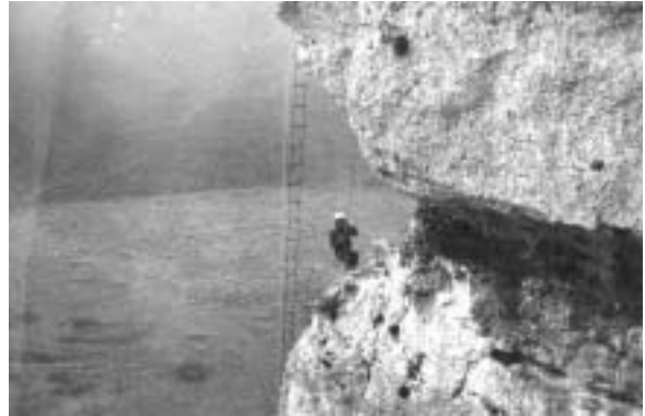
Fig. 16 - Pulo di Altamura - Esercitazione di soccorso con scaletta.