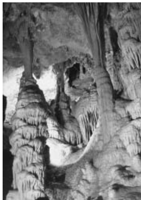
Fig. 4 - Colonne stalagmitiche nella Grotta di Torre di Lesco .