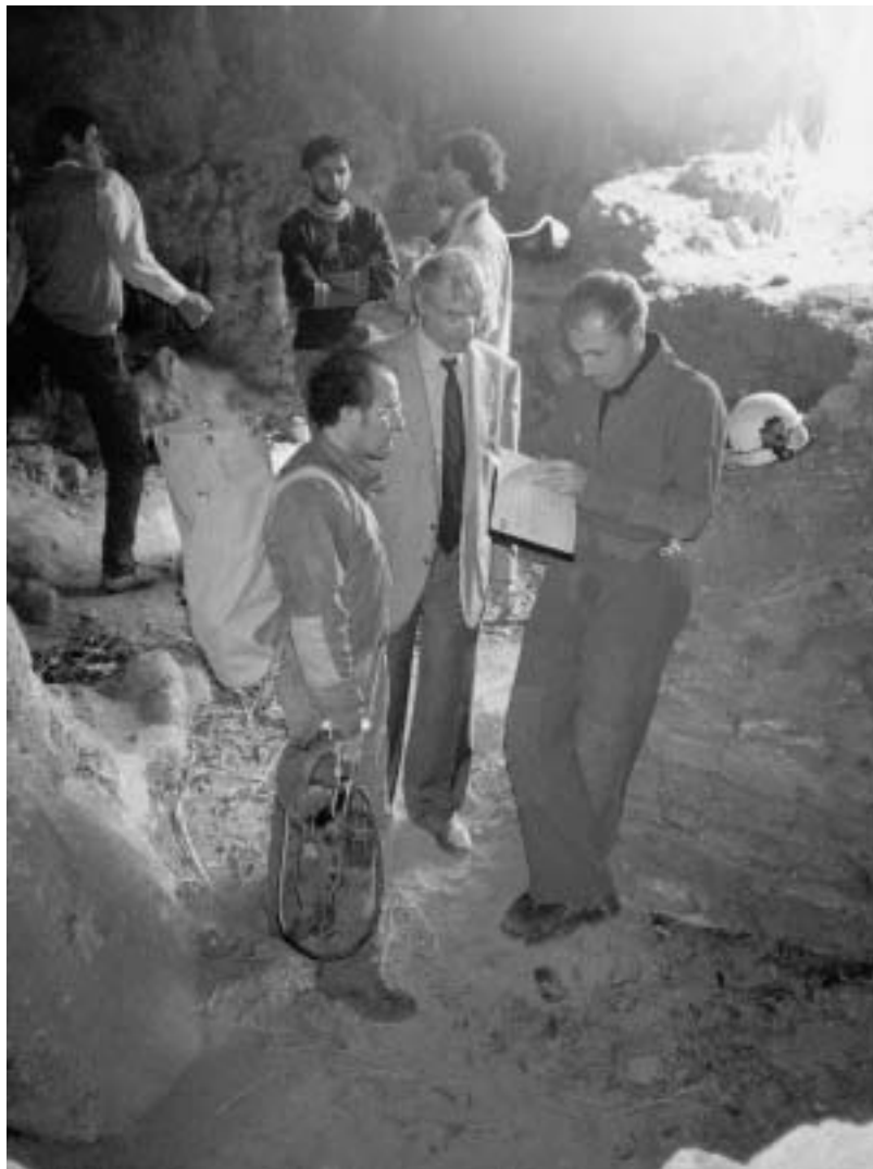
Fig. 19 - Speleologi del C.A.R.S. e Piero Angela prima delle riprese all’ Uomo di Altamura nella Grotta di Lamalunga .