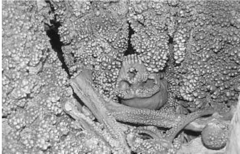
Fig. 18 - Scheletro umano fossile noto come “ Uomo di Altamura ” scoperto nella Grotta di Lamalunga nel 1993.