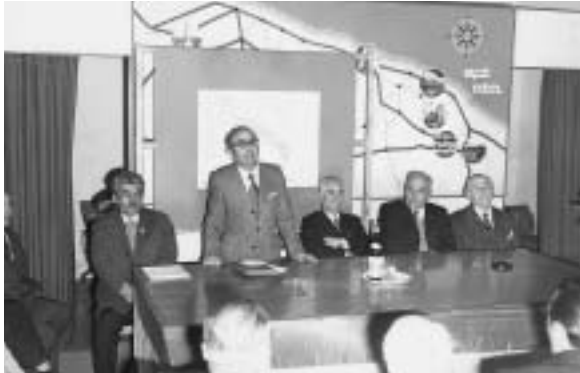
Fig. 14 - Prof. Franco Anelli al convegno “ Civiltà delle Grotte ” in Altamura - Anno 1972.