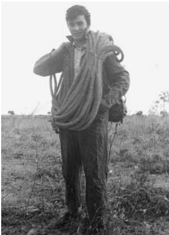
Fig. 15 - Momento di avvicinamento all’Inghiottitoio del Pulo di Altamura con le tipiche corde dette “ canaponi ”.