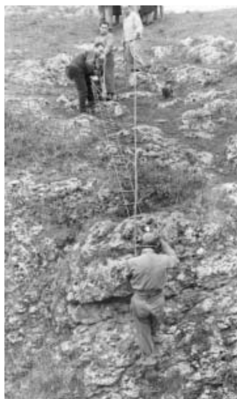
Fig. 5 - Prima esplorazione della Grave di Faraualla .