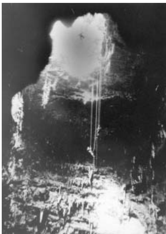
Fig. 13 - Discesa del C.A.R.S. con scalette nella Grave di Castellana.