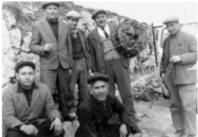
Fig. 2 - Gruppo di speleologi alla seconda esplorazione della Grotta di Torre di Lesco .