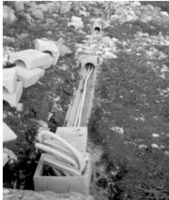
Fig. 9 - Visione dal basso della posa dei cavi sulla collina di Lamalunga nel tratto che va dall'ingresso della grotta alla base della collina.