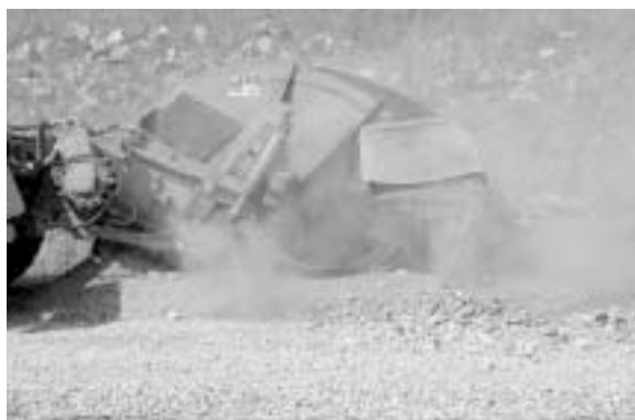
Fig. 12 - Particolare della fresa circolare utilizzata per la realizzazione del cavidotto durante l'esecuzione dello scavo.