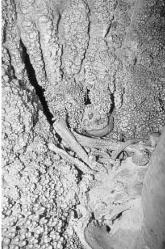
Fig. 2 - Visione d'insieme del giacimento contenente le parti dello scheletro, completamente ricoperto di concrezioni calcitiche.