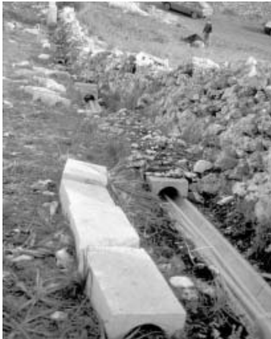
Fig. 8 - Cablatura della collina di Lamalunga nel tratto dall'ingresso della grotta fino alla lama sottostante.

La trincea è stata successivamente ripulita dai detriti di scavo e sono stati ricavati, ogni 50 m, gli alloggiamenti per i pozzetti di ispezione e manutenzione (Fig. 13). In prossimità della Masseria Ragone la realizzazione dei piazzali adibiti a parcheggio ha provocato l'innalzamento del piano di campagna di circa 8 m, renden-