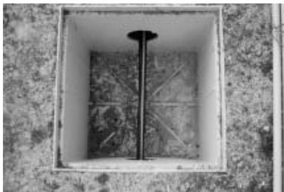
Fig. 15 - Cavi passanti all'interno di un pozzetto di ispezione alla fine delle operazioni di cablaggio.

Si è proceduto anche all'allestimento di moduli software destinati alle work station nella stazione remota per le funzionalità di orientamento e illustrazione delle esplorazioni effettuate direttamente con le realizzazioni remo-