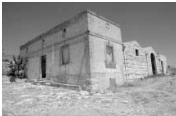
Fig. 5 - Masseria Ragone . Visione dall'esterno dell'antico complesso edilizio rurale destinato dall'Amministrazione comunale ad ospitare la prima stazione di trasmissione e ricezione dati in sede remota.