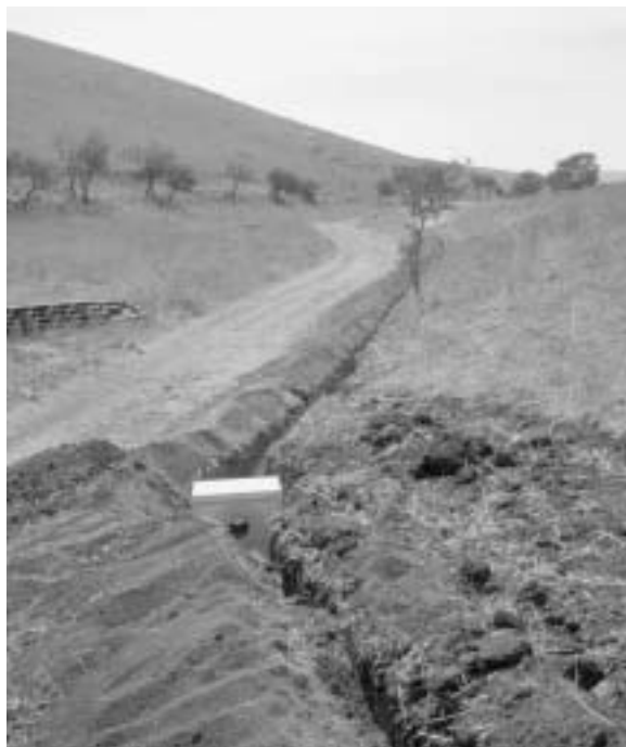
Fig. 13 - Trincea realizzata per la posa del cavidutto, alla fine delle operazioni di scavo, con sistemazione dei pozzi di ispezione.

Sono stati anche adoperati materiali di supporto per la realizzazione di linee temporanee per le operazioni di prova e taratura.