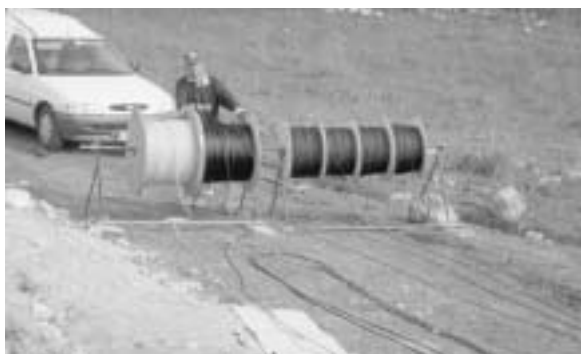
Fig. 14 - Operazione di cablaggio delle diverse linee all'interno del cavidutto.