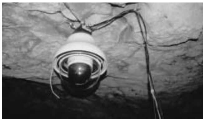
Fig. 4 - Esempio di posizionamento in grotta in via sperimentale di una piattaforma teleoperata con cupola di protezione.

Ogni piattaforma è stata fornita di proprio apparato di illuminazione realizzato con lampade alogene a luce bianca in via temporanea per le operazioni di taratura della messa a fuoco e della portata ottica destinate ad essere successivamente sostituite da sistemi di illuminazione con tubi a scarica ovvero con pannelli elettroilluminescenti a luce verde, onde non inter-