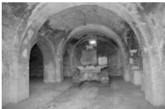
Fig. 6 - Masseria Ragone . Visione dell'interno prima dei lavori di restauro.