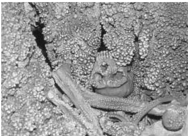
Fig. 1 - L’uomo di Altamura. Primo piano del cranio.

Lo scheletro si trova in una grotta carsica ad una profondità di circa otto metri alla quale si accede calandosi in un cunicolo verticale e attraversando una galleria lunga circa 60 metri ed è coperto interamente da formazioni calcitiche (Fig. 1). La grotta in cui è custodito il reperto presenta un’architettura complessa ed è formata da due rami principali (dei quali uno contenente lo scheletro) in precarie condizioni di stabilità, data la presenza di dinamiche carsiche (di dissoluzione e di deposizione) tuttora in atto, con apprezzabili fenomeni di microcrollo.