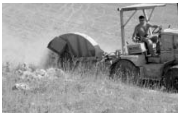
Fig. 11 - Fresa circolare utilizzata per la realizzazione dello scavo.