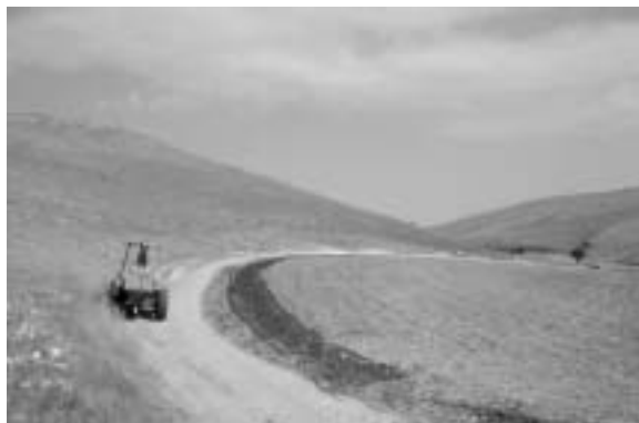
Fig. 10 - Realizzazione dello scavo per la posa dei cavidotti nel tratto che congiunge il giacimento dalla base della collina alla Masseria Ragone.