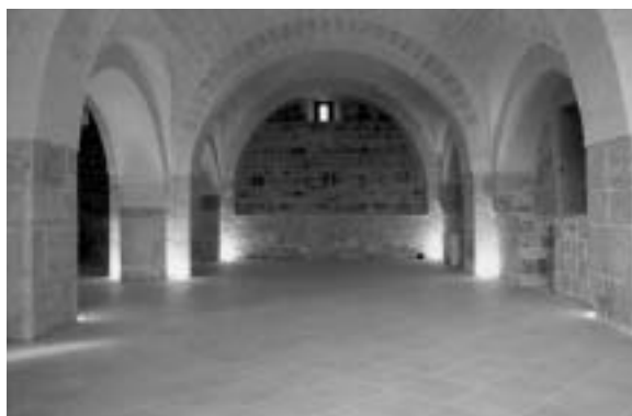
Fig. 7 - Masseria Ragone . Visione dell'interno dopo l'effettuazione dei lavori di restauro.