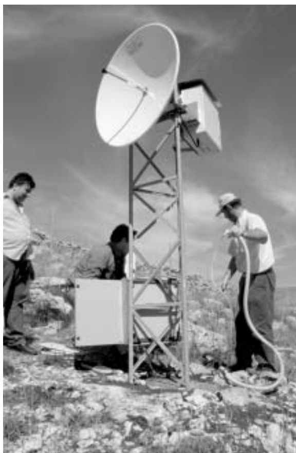
Fig. 16 - Sistemazione della parabola per il collegamento con ponte radio tra la collina di Lamalunga ed il Museo Archeologico di Altamura.